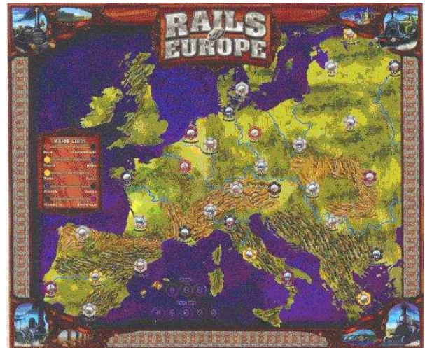
Cartes de nabab du chemin de fer

Plateau de jeu : La carte de l'Europe au début de l'ère du chemin de fer au milieu du 19 ème siècle. La carte est divisée en hexagones. Chaque hexagone peut contenir une ville, de la montagne (marron) ou du terrain ouvert (vert). L'eau (bleue) peut être présente et des arêtes (lignes marron foncé) peuvent être indiquées le long des côtés de quelques hexagones.